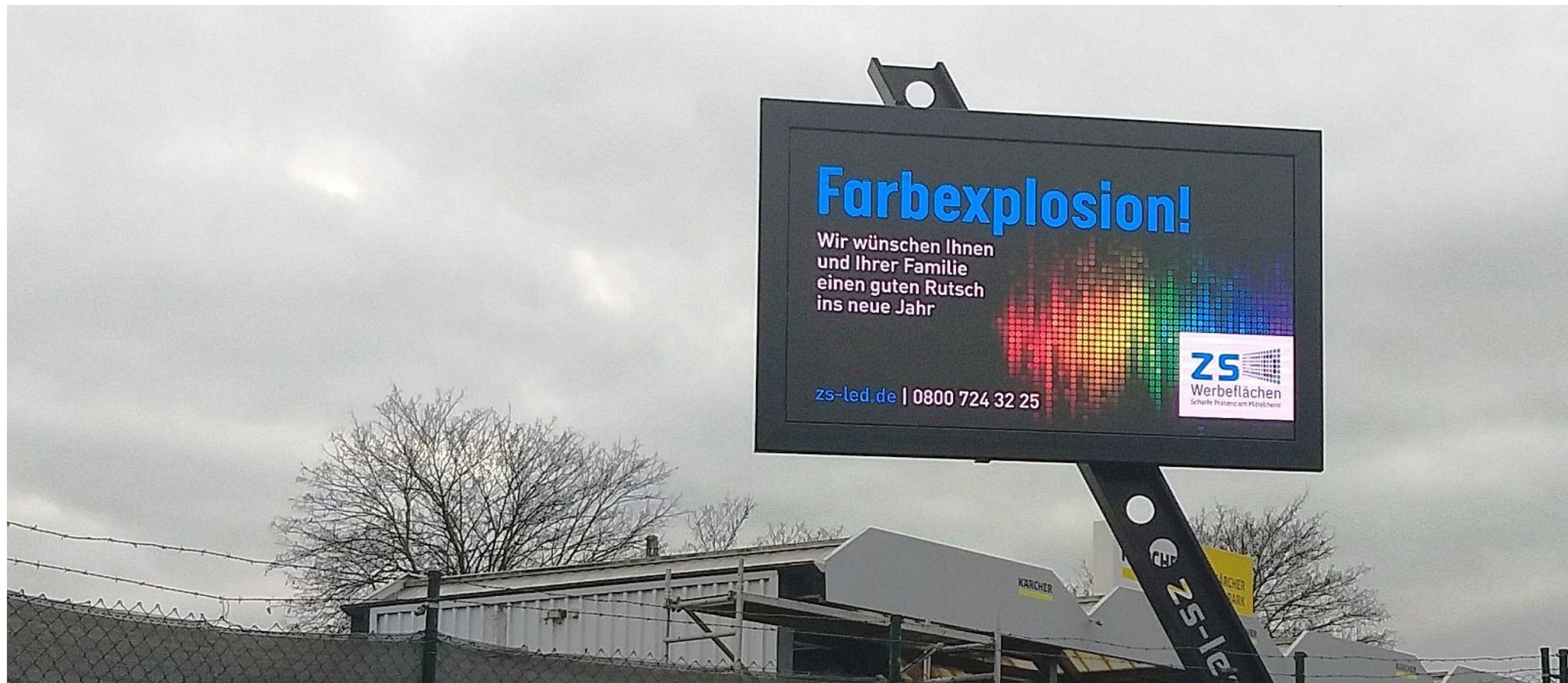
Foto-Dokumentation Aufbau der einseitigen LED-Anlage Neuwied